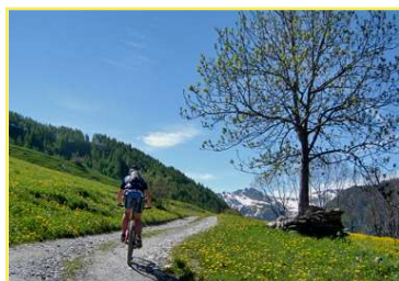
Tratto di salita verso Gr. Serri