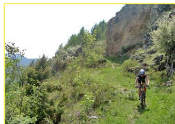
Tratto di discesa lungo il single track prima di raggiungere b.ta Vallone