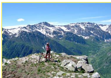
Panoramica da Punta Colour (2068 m)