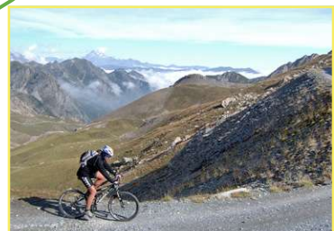
Salita lungo la militare (altopiano della Gardetta)