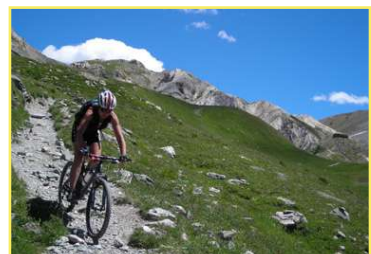
Discesa verso Prato Ciorliero