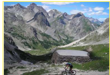
Primo tratto di discesa dal P. della Gardetta