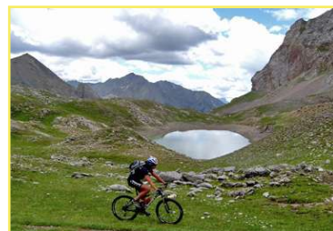
Lac du Vallonet