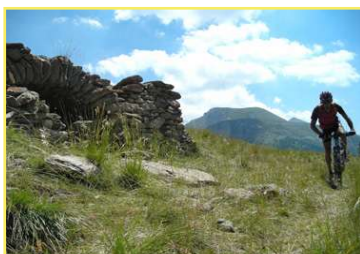
Plateau de Mallemort