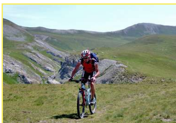
Tratto di discesa dal Colle delle Munie verso Larche