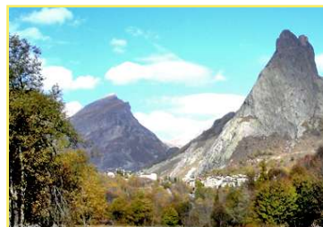
Panoramica su b.ta Chiappera