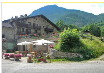
Uno scorcio di b.ta Ponte Maira