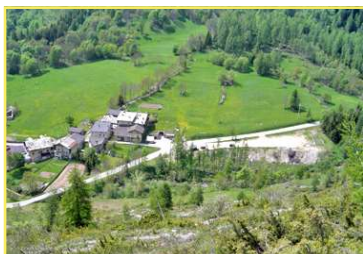
Un tratto del percorso nei pressi di b.ta Ponte Maira